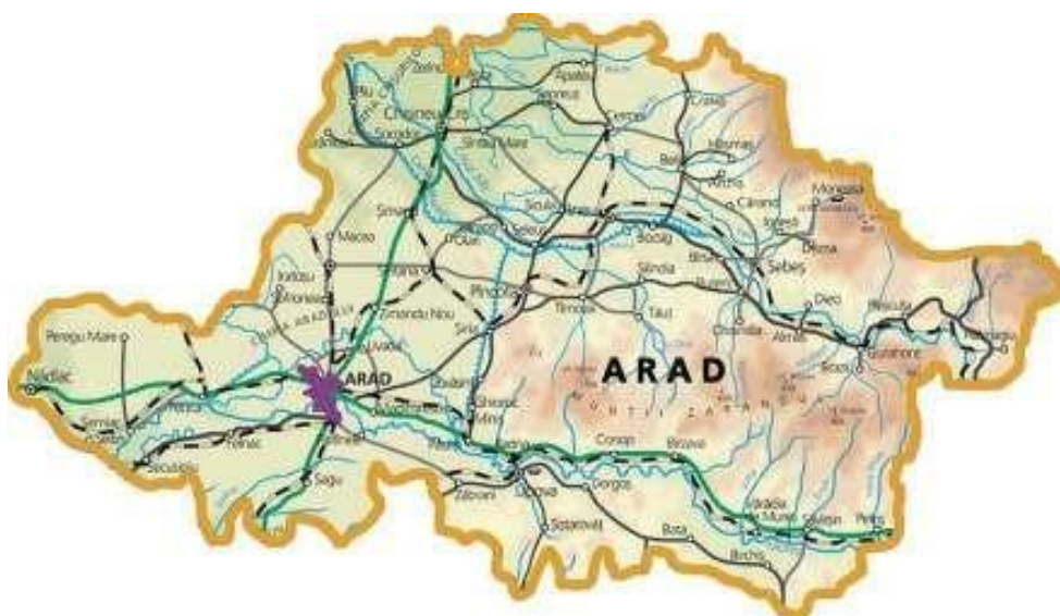
Figura 1 Harta județului Arad

Data fiind suprafața județului, acesta constituie o pondere de 3,65% din suprafața totală a României de 238.391 km 2 fiind al 6-lea județ ca mărime la nivel național. La nivelul Regiunii Vest, Județul Arad constituie o pondere de aproximativ 24,2% din suprafața totală de 32.028, încadrându-se printre județele de mărime mijlocie